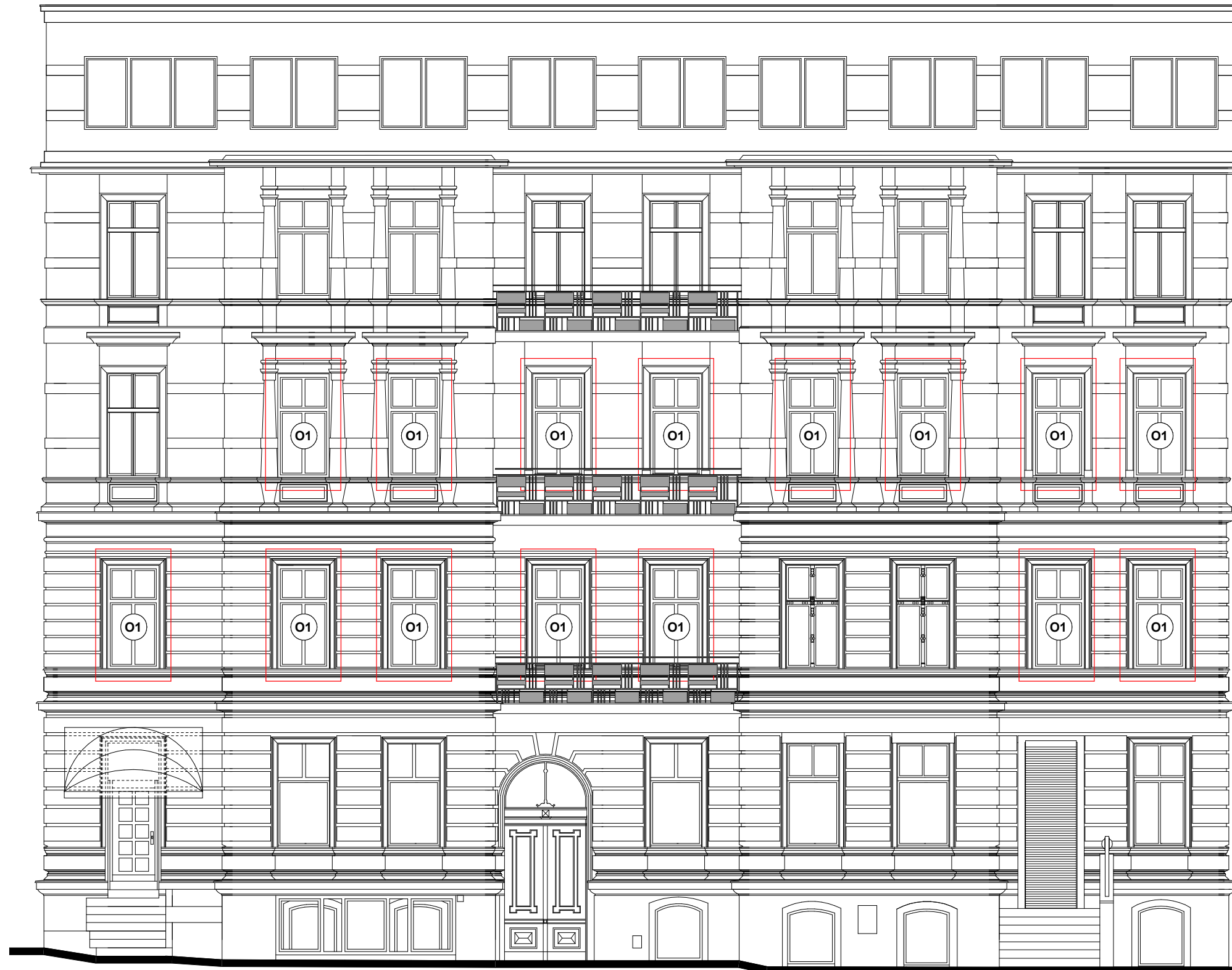
WIDOK - 5