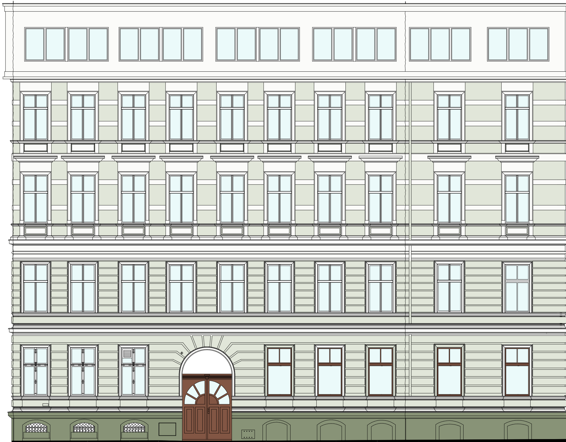
WIDOK - 1