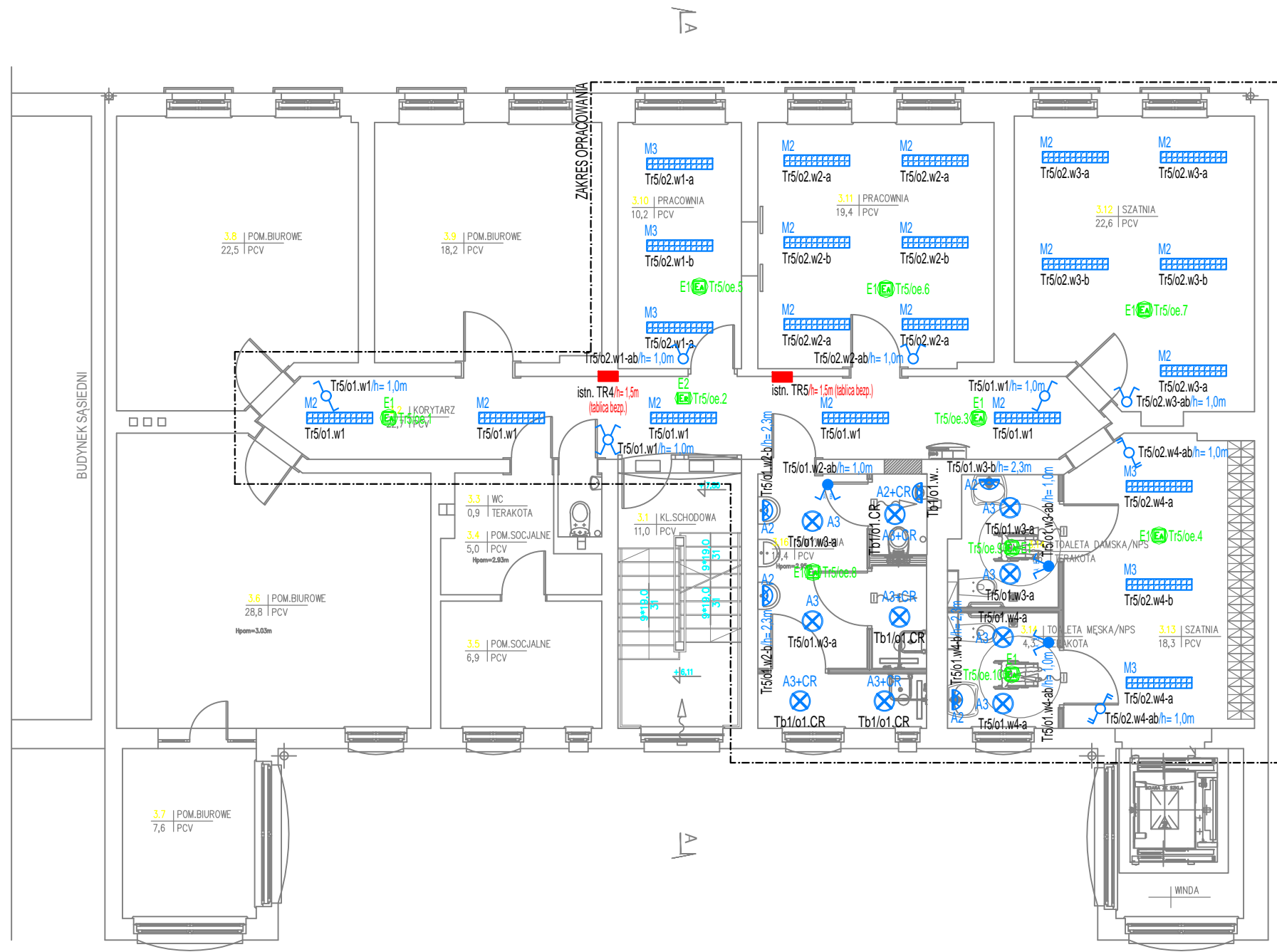
RZUT II PIĘTRA - ARANŻACJA SKALA 1:50